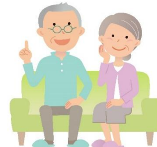
老後は小さな家に 住み替えたい！