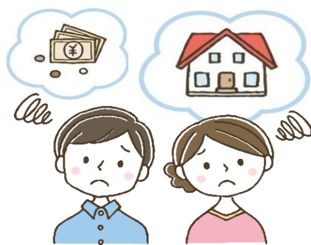
住宅ローン返済のお悩み

大切な不動産の売却は 地域密着・確かな実績の ダイイチハウスに おまかせください！ 複雑なお手続きもお手伝いします