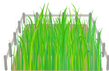
使う予定のない土地