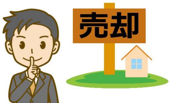
ご近所に内緒にしたい