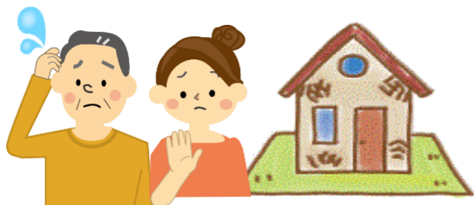
相続したが住まない家