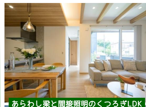
あらかし梁と間接照明のくつろぎLDK