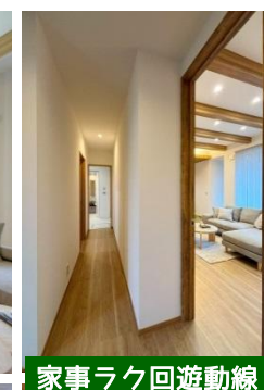
家事ラク回遊動線

生活を愉しむためのこだわり間取り 家事ラク回遊動線とココに欲しい収納 高耐震・高断熱・省エネに優れた住宅