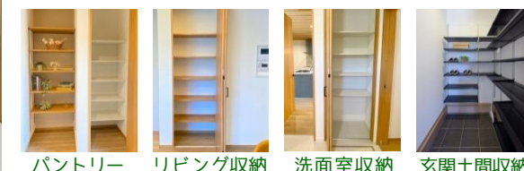
パントリー リビング収納 洗面室収納 玄関土間収納

＊家事ラク動線と家事ラク収納＊ ①水まわりを1つにまとめた間取り 家事動線が短く使い勝手バツグン！ ②使いたい場所に使う物が片付く収納 使う場所にしまうと家事の時短に！