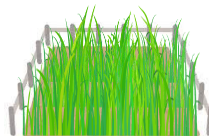
使う予定のない土地