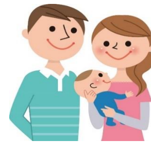
新築用の土地がほしい!