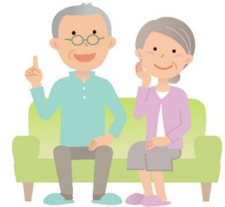
老後は小さな家に 住み替えたい!