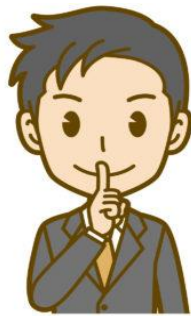
ご近所に内緒にしたい