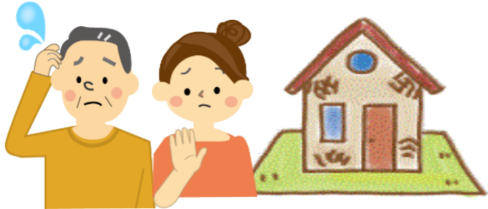
相続したが住まない家