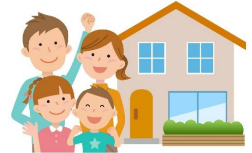
すぐに住める 中古住宅がほしい!