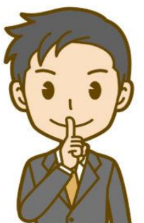
ご近所に内緒にしたい