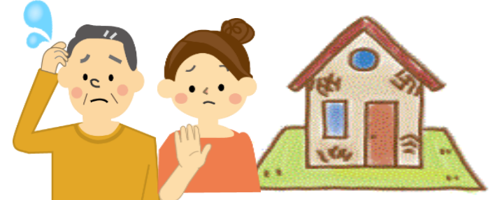
相続したが住まない家