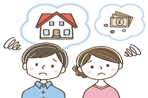
住宅ローン返済のお悩み