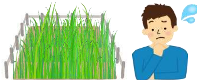
使う予定のない土地