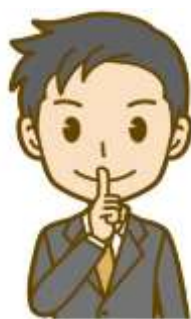
ご近所に内緒にしたい