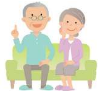
老後は小さな家に 住み替えたい!