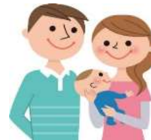
新築用の土地がほしい!