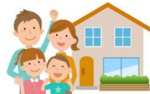
すぐに住める 中古住宅がほしい!