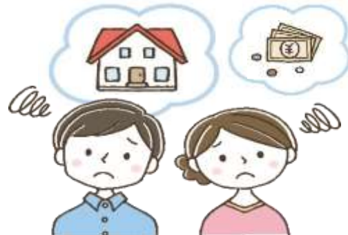
住宅ローン返済のお悩み