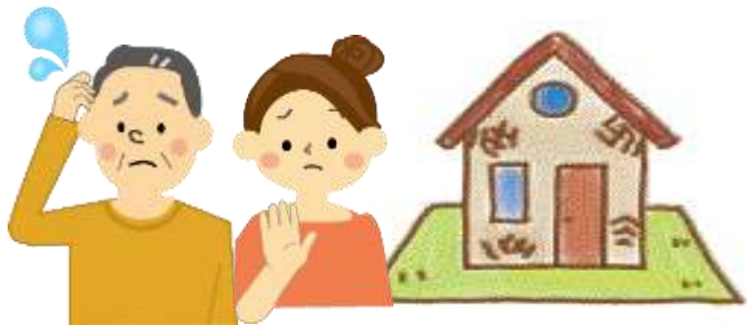
相続したが住まない家