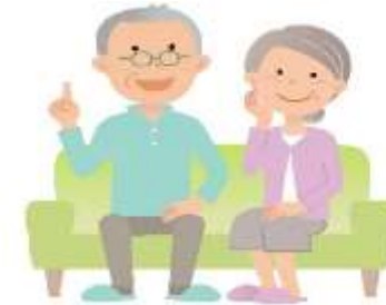
老後の住み替えのご相談