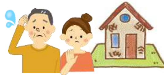
相続したが住まない家

豊里ネオポリス地域実績26年連続No.1の ダイイチハウスにおまかせを！！ 大切な不動産の売却やお悩みごとは 今すぐ お気軽に ご相談ください。