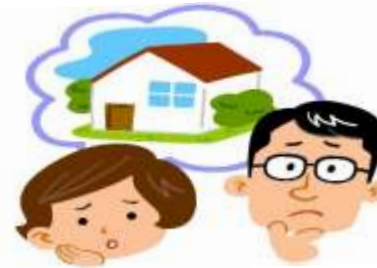
住宅ローン返済のお悩み