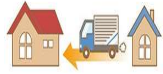
転勤で戻って来られない