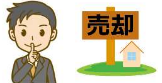
ご近所に内緒にしたい