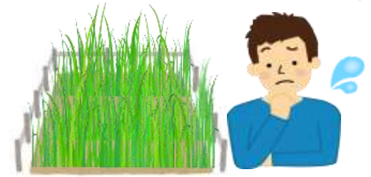
使う予定のない土地