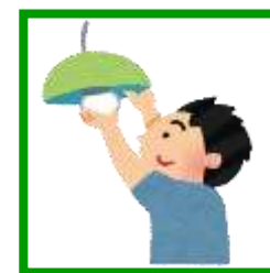
高い場所の 電球交換